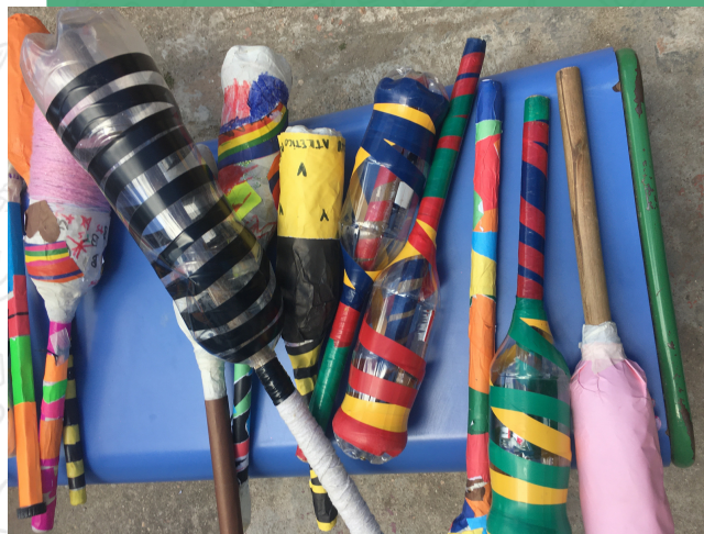
Clavas para malabares